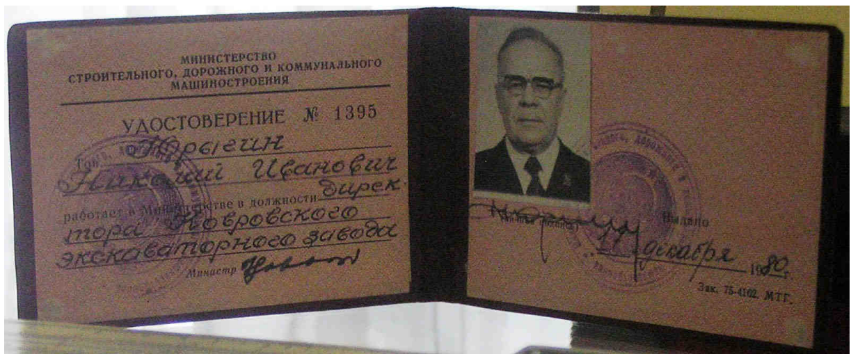
фото с выставки в КИММ (2017)