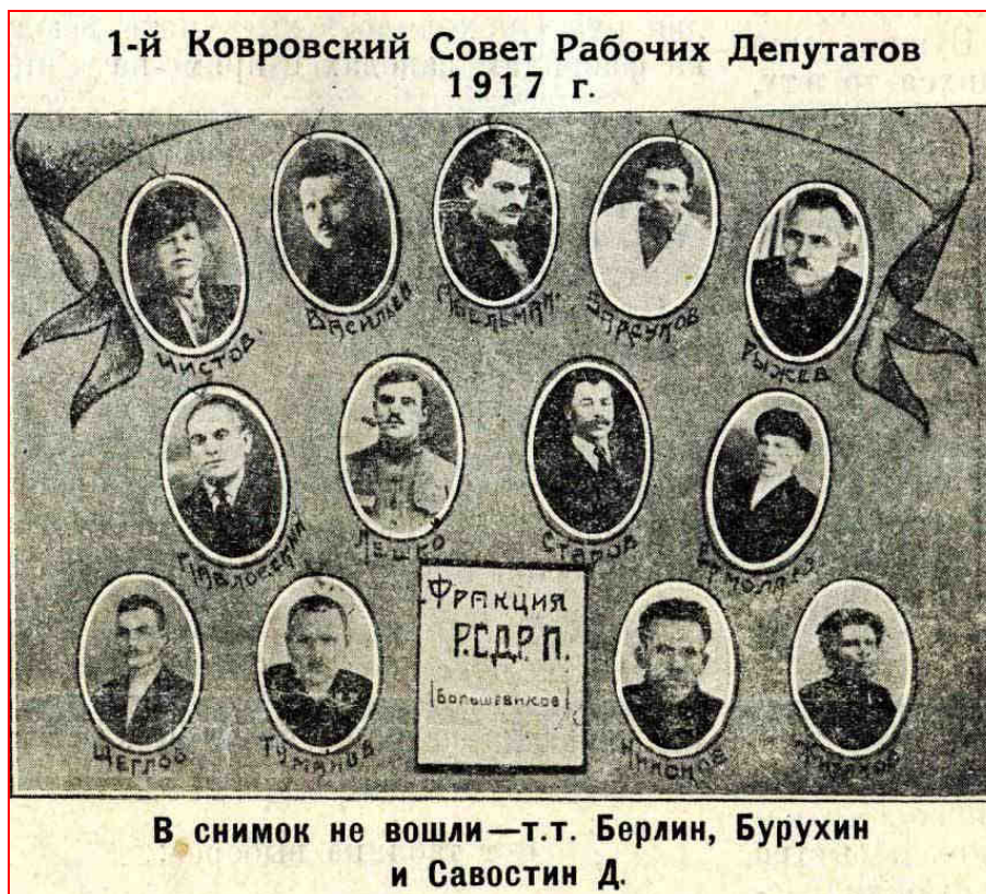
Фракция большевиков в 1-м Ковровском Совете рабочих депутатов (март 1917 г.) [«Десятилетие Октябрьской революции», 1927]