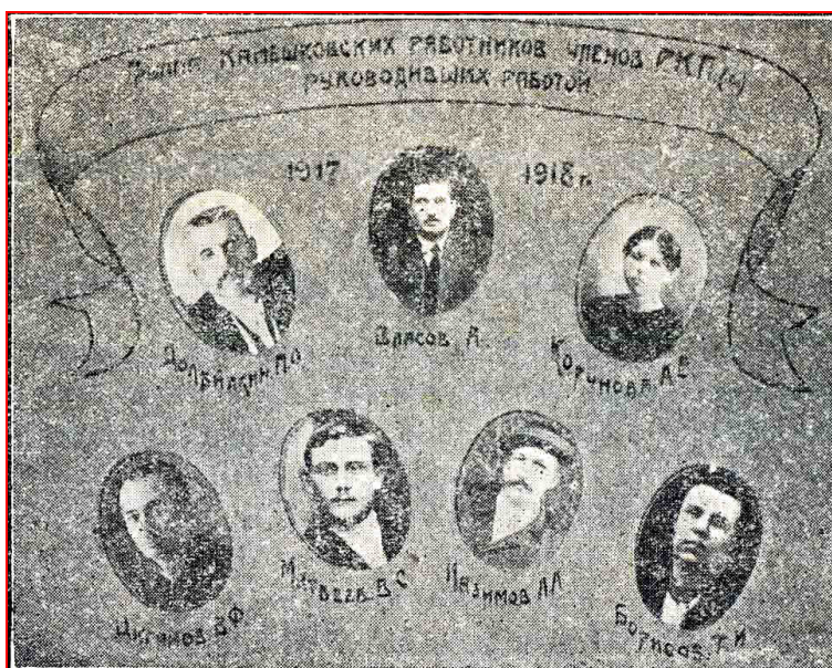
Ячейка РКП(б) фабрики им. Я.М. Свердлова (1917-1918)

После февральской революции приехал в Ковров и сразу же включился в революционную работу...».