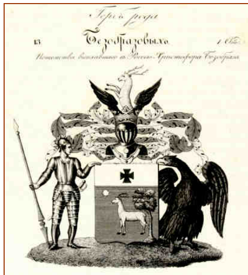
Герб владимирских дворян Безобразовых