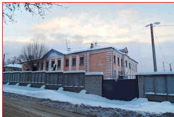
Школа-интернат № 20 (пр-д Северный, 8-а) (1956 – 1960 гг.)