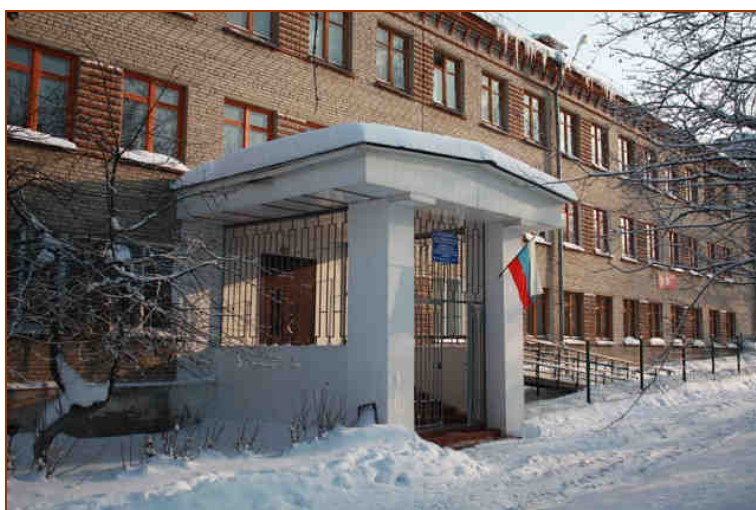
ул. Белинского, 4-а (с 1963 г.)