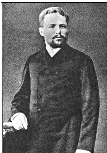
П.Г. Герасимов, ковровский городской глава с 1884 по 1891 гг., купец 1-й гильдии (слева) И.А. Треумов, ковровский городской глава с 1891 по 1898 гг., купец 1-й гильдии (справа)