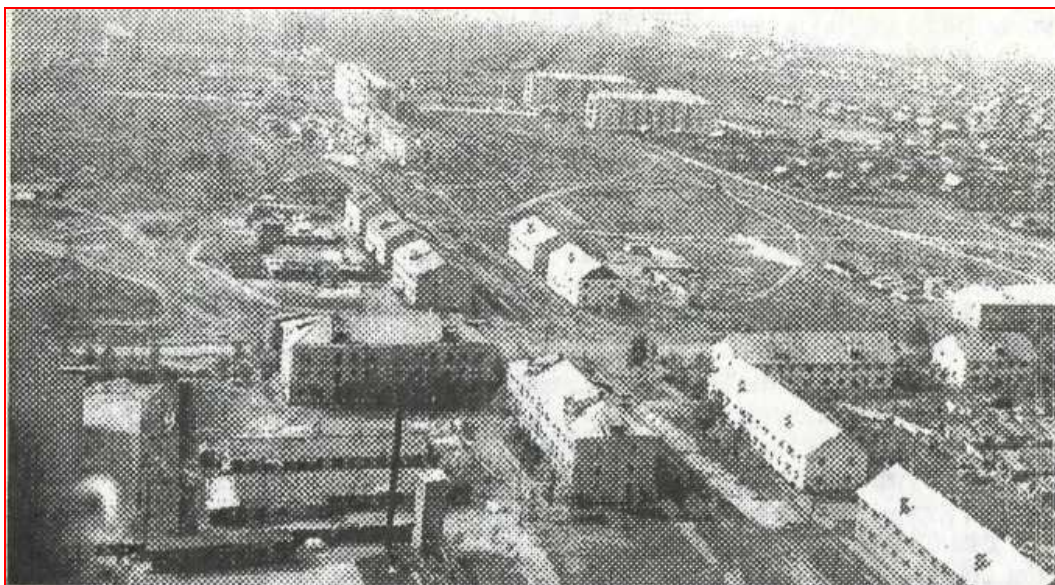
Застройка 623-го квартала (перекрёсток Моховая-Грибоедова) [«Рожд.сборник №8», 2001]