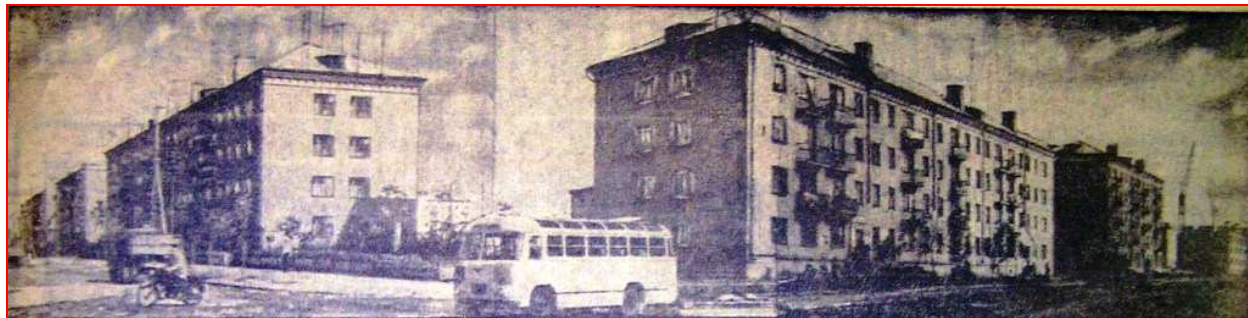
Ковровские «Черёмушки» (перекрёсток улиц Киркиж и Подлесной) [ «РК» ,10.10.1963]

1963 г. « Растёт, хорошеет наш город. Жители Молодёжного городка хорошо помнят пыльные, заросшие бурьяном пустыри. А теперь это один из благоустроенных районов города. Его по праву называют ковровскими Черёмушками. Только в этом году здесь выстроено 3 многоэтажных дома » [ «РК» ,10.10.1963].