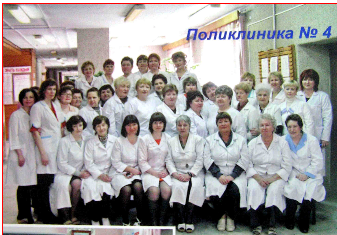
Коллектив 4-й поликлиники КГБ № 2 (2014 г.) [«Фотоальбом «80 лет ЦРБ», 2014]