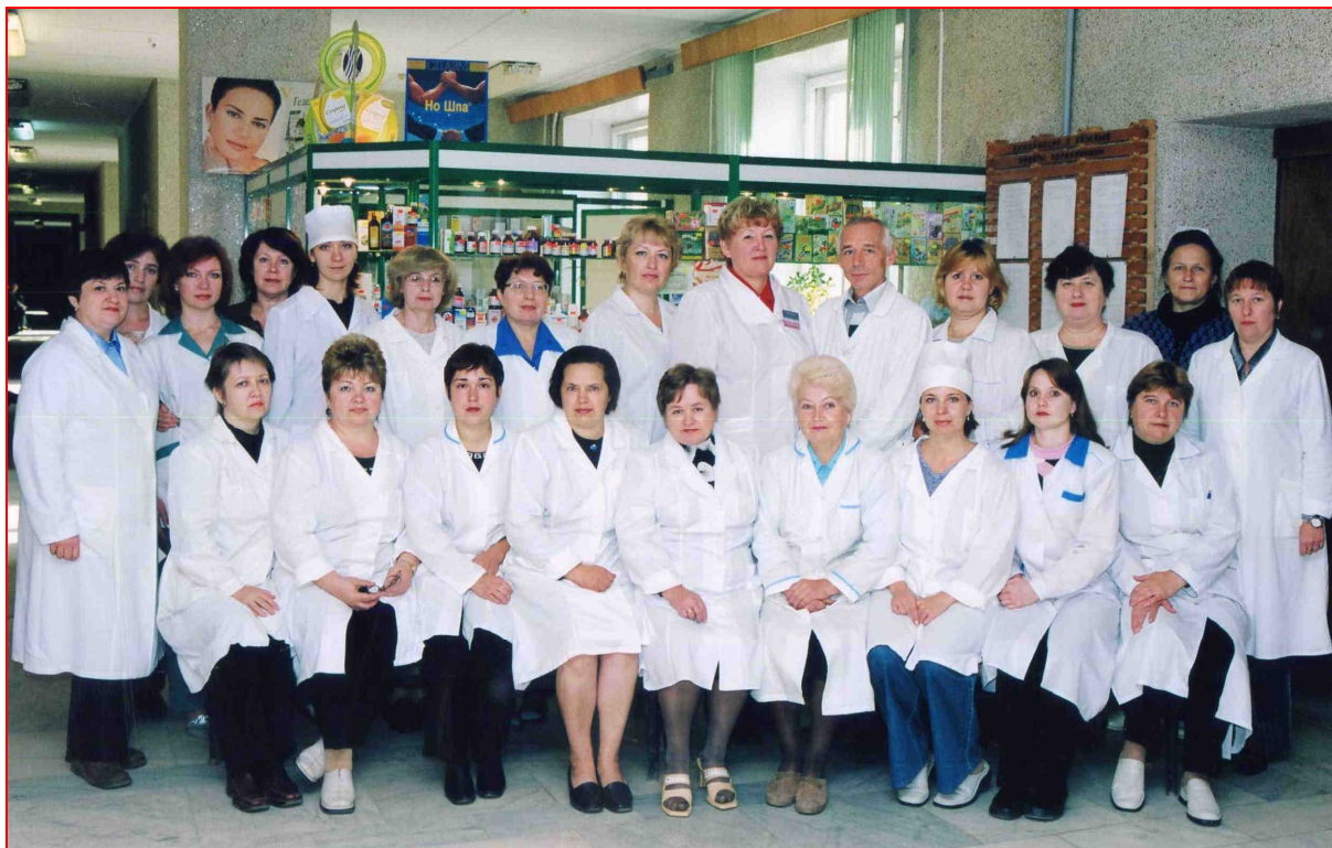
Коллектив 4-й поликлиники КГБ № 2 (2004 г.)