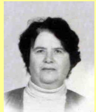
(1961 г., 33 года)