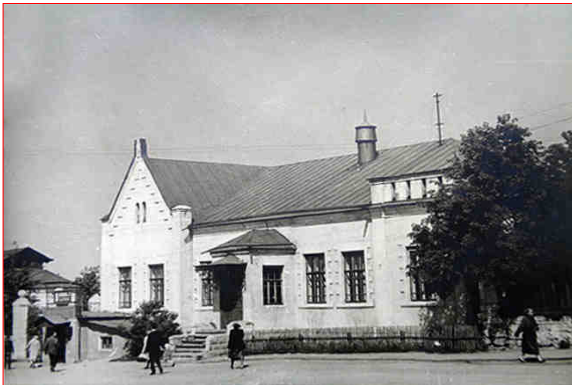
Поликлиника 1-й горбольницы