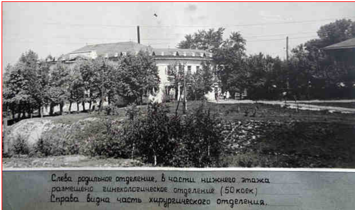
(фото из фотоальбома «150-летие 1-й горбольницы», 1962 г.)