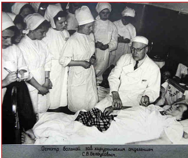
(фото из фотоальбома «150-летие 1-й горбольницы», 1962 г.)