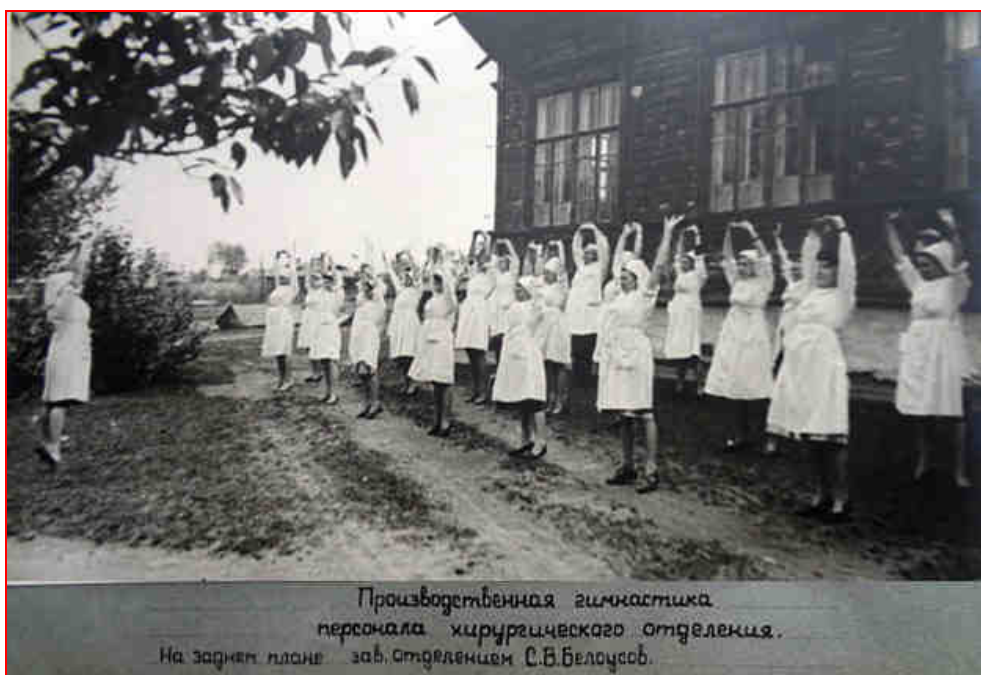
(фото из фотоальбома «150-летие 1-й горбольницы», 1962 г.)