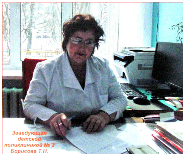
(«Фотоальбом «80 лет КГБ №2», 2014)