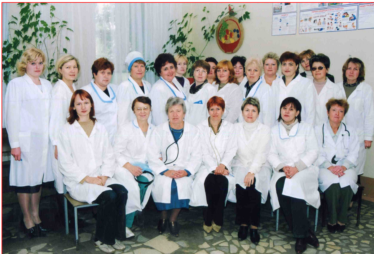
Коллектив детской поликлиники № 2 (2004 г.) [«Фотоальбом «70 лет ЦРБ», 2004]