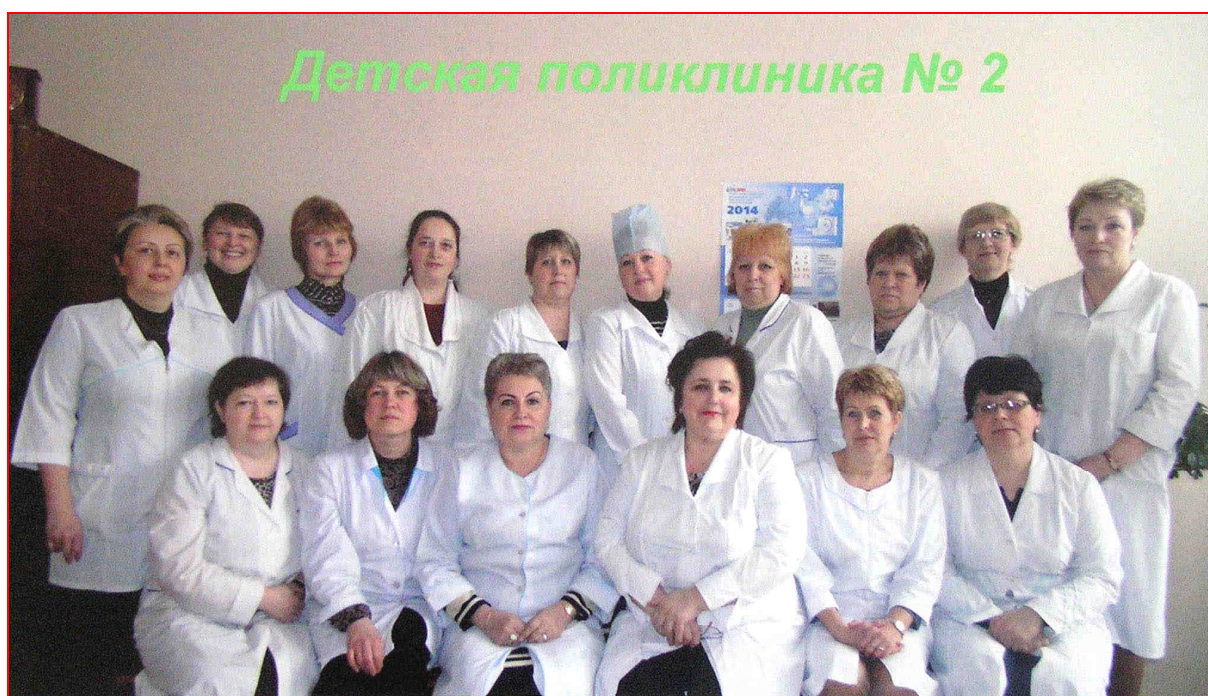
(«Фотоальбом «80 лет КГБ №2», 2014)