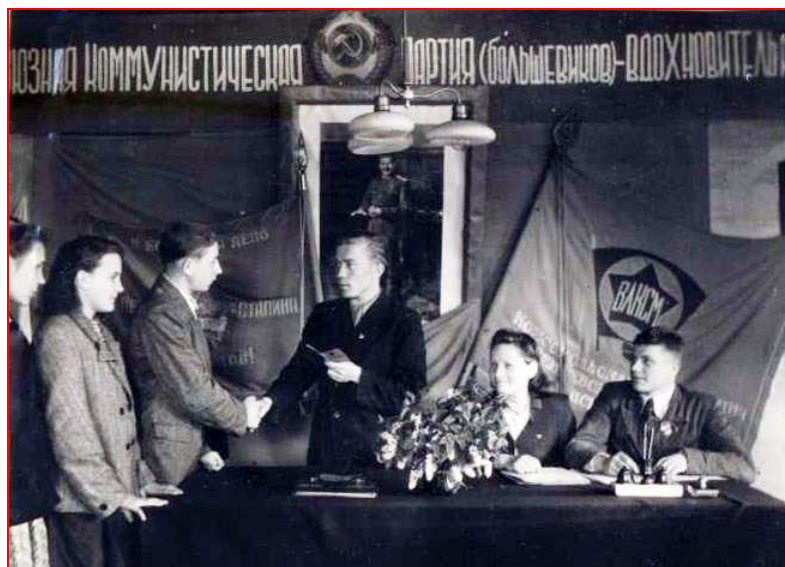
Приём лучших пионеров в комсомол и лучших комсомольцев в партию