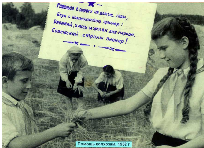
Помощь колхозам. 1952 г