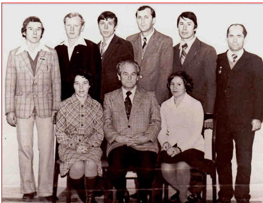
Кафедра ТМС