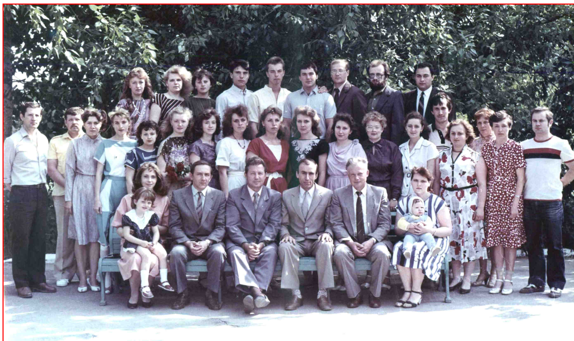
Выпуск кафедры ГПА и ГП КТИ (1987 г.)

1990 г. (31 год) «В 1990 г. в связи с выделением кафедре ГПА и ГП дополнительных учебных площадей в лабораторном корпусе приступил к работе по организации новых учебных лабораторий.