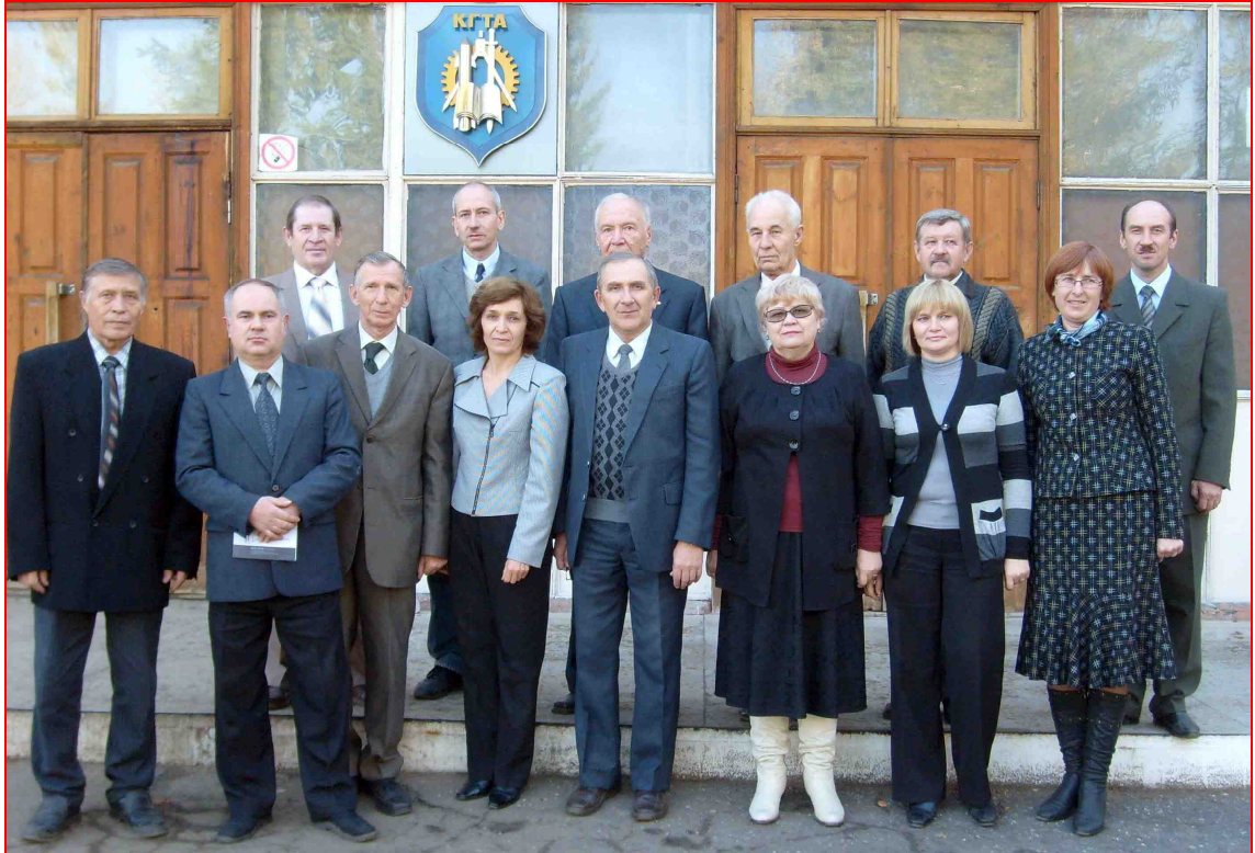
Коллектив кафедры ГПА и ГП (2010 г.)