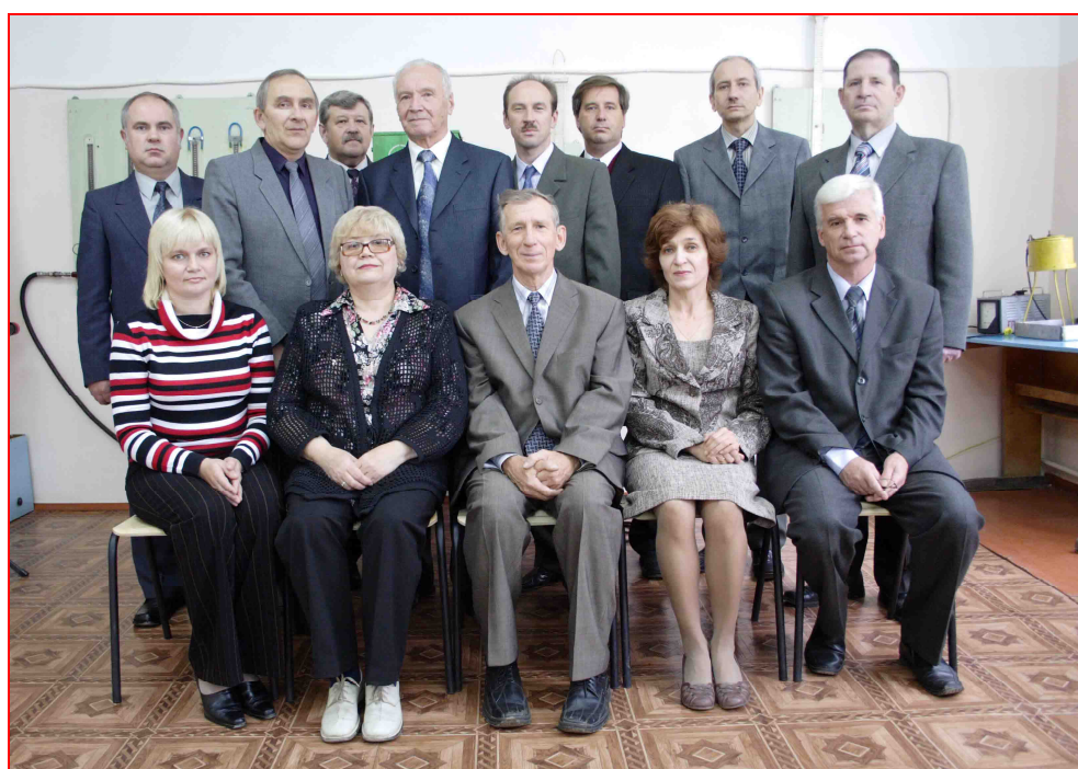
Коллектив кафедры ГПА и ГП (2009 г.)