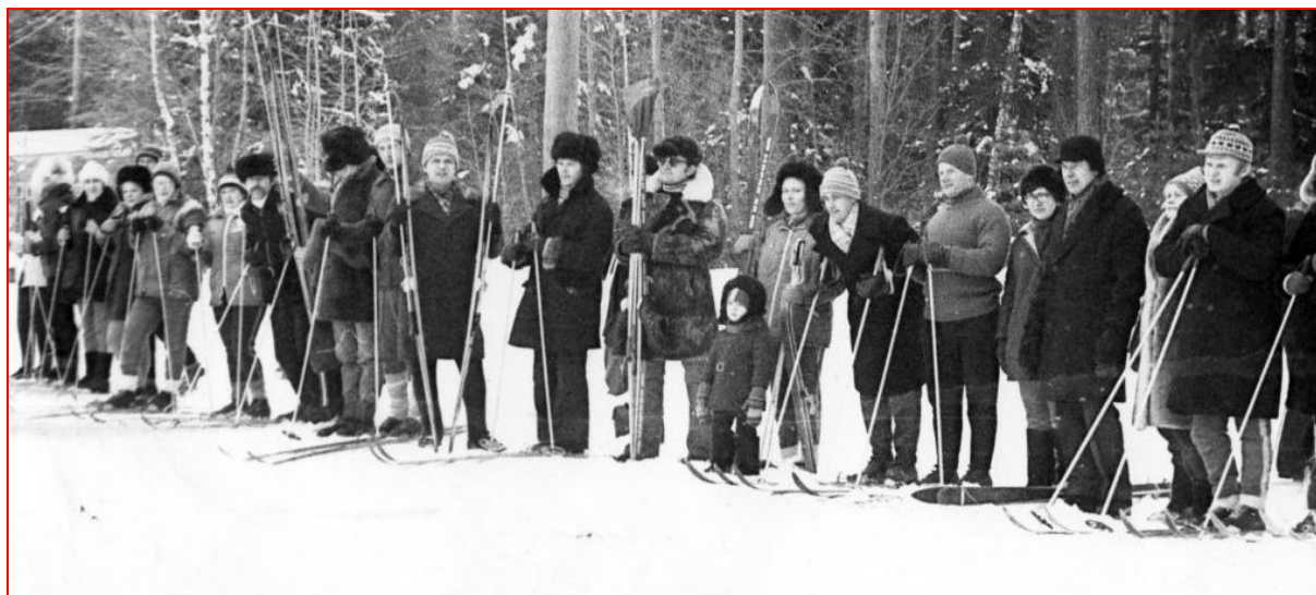
День «Здоровья» в КФ ВПИ

1979 г. (34 года) «День Здоровья» в КФ ВПИ (1979 г.).