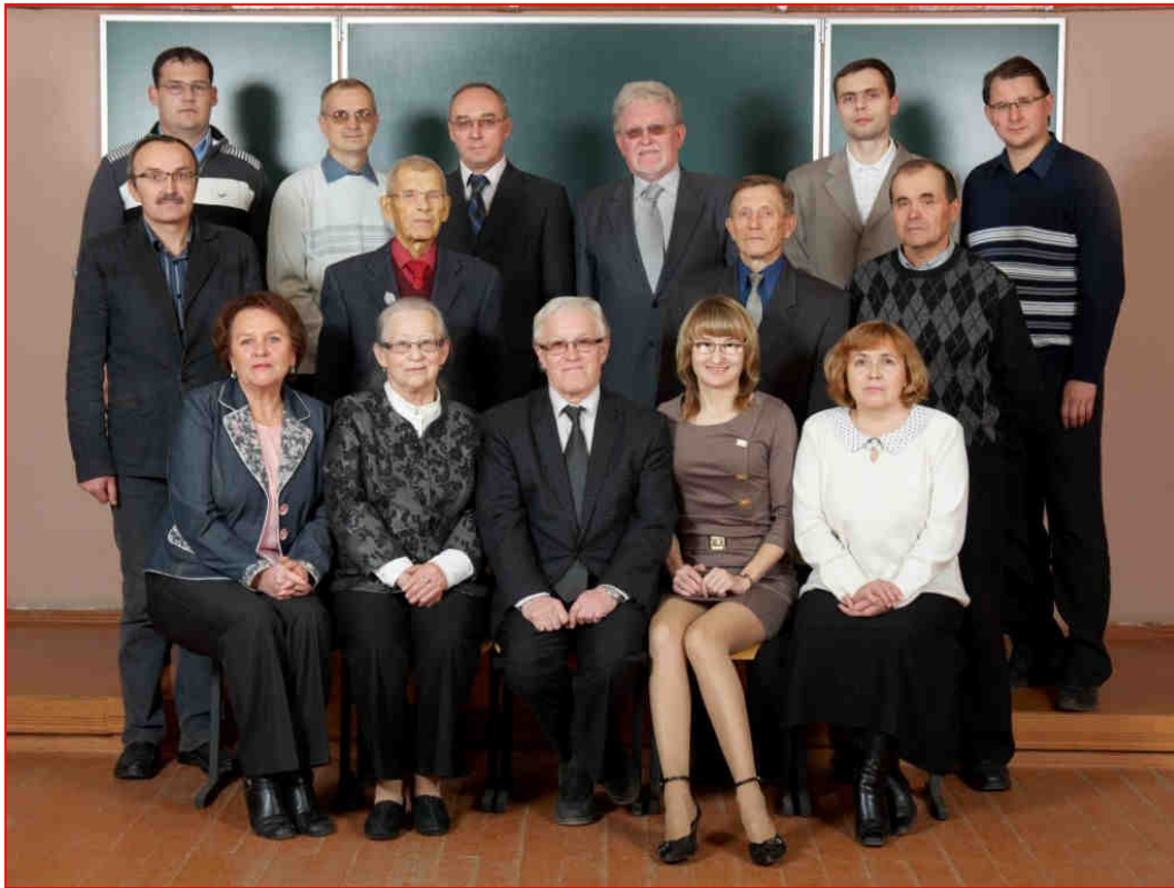
Преподаватели и сотрудники кафедры приборостроения (октябрь 2011 г.)