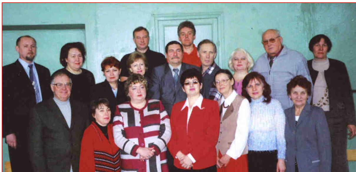
Преподаватели энергомеханического колледжа [«КЭМТ», 2005].