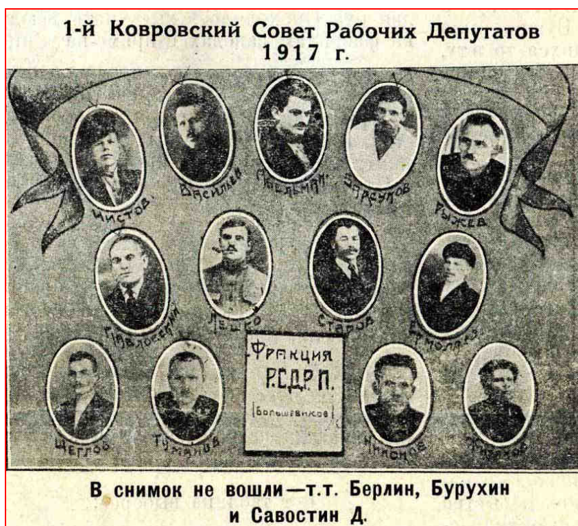
Фракция большевиков в 1-м Ковровском Совете рабочих депутатов (март 1917 г.) [«Десятилетие Октябрьской революции», 1927]