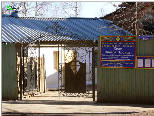
Церковь Троицы (2010)