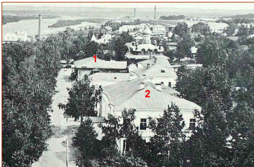
Под номером 1 - здание больницы, под номером 2 - здание Присутственных мест, между ними каменное здание тюрьмы

Первое время больница составляла главную статью расхода в городском бюджете. На её содержание расходовалась та же сумма (более четверти бюджета!), что и на полицию, пожарную команду, магистрат, сиротский суд, вместе взятые. При скудных городских доходах содержание больницы было несколько обременительно для города» [И.Зудина, «ЗТ», 19.08.1994].