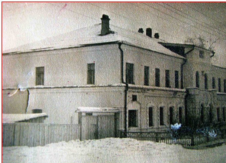
Школа-интернат № 16 (ул. Першутова)

1963 г. «В 1963 г. интернат переехал в новое здание, более комфортное и удобное для обучения - на ул. Першутова...» [«КГ», 14.10.2010].