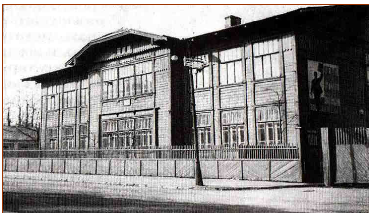
Бывшая Феодоровская мужская двухклассная ц.-пр. школа.

С 1918 г. – ж.д. школа II ступени; с 1923 г. – ж.д. школа семилетка, позже – ж.д. неполная средняя школа №7; в 1952 г. – объединена с ж.д. средней школой №6.